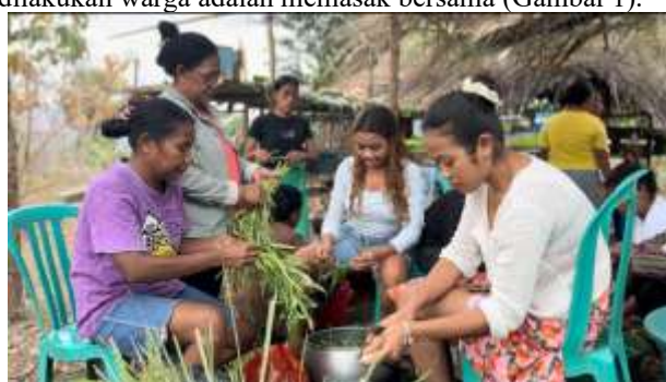
Gambar 1. Memasak Bersama sebagai Bentuk Gotong Royong

Hasil akhir dari semua tahapan tersebut adalah sebuah dokumenter yang menampilkan kehidupan masyarakat Desa Abafala secara komprehensif dan terjaga. Visualisasi aktivitas masyarakat dalam dokumenter berfungsi sebagai representasi simbolik yang membangun narasi autentisitas, yang merupakan elemen kunci dalam pembentukan citra destinasi menurut perspektif branding destinasi. Dokumenter bukan hanya menjadi arsip visual, tetapi juga sebagai media edukasi dan penguatan identitas lokal yang dapat dinikmati oleh khalayak luas. Salah satu kegiatan gotong-royong yang paling sering dilakukan warga adalah memasak bersama (Gambar 1).