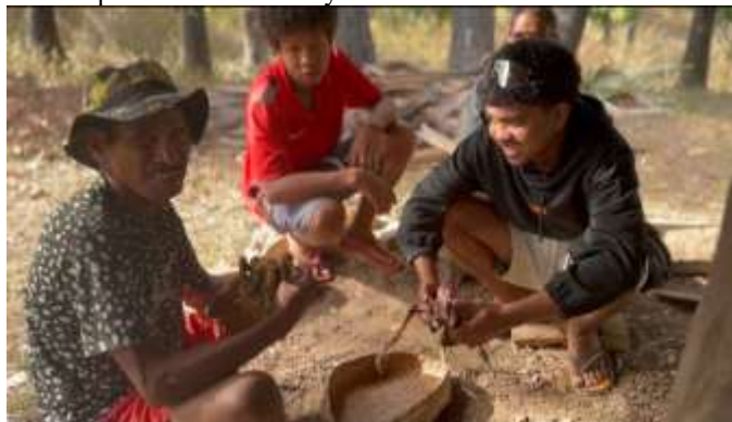
Gambar 3. Tradisi laki-laki untuk urusan pemotongan hewan

Identitas lokal yang diangkat dalam dokumenter ini menampilkan kegiatan sehari-hari warga laki-laki dalam persiapan ritual adat. Mereka biasanya bertanggung jawab memotong hewan yang umum dikonsumsi pada acara adat desa, yaitu ayam, babi, kambing, dan kerbau (Gambar 3). Hewan-hewan tersebut sebagian besar adalah sumbangan dari warga, sebagai wujud kuatnya nilai kekerabatan. Tradisi budaya Abafala bukan sekadar warisan masa lalu, melainkan masih lestari dan relevan dalam kehidupan sehari-hari masyarakat saat ini.