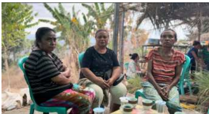
Gambar 6. Warga antusias mengikuti proses produksi film

Penelitian serupa di desa Selo Malere, Kabupaten Aileu, Timor Leste oleh Achmad dkk. (2024) menekankan pentingnya keterlibatan komunitas lokal dalam mengembangkan potensi budaya. Temuan mereka menunjukkan bahwa partisipasi masyarakat menumbuhkan rasa memiliki terhadap budaya sekaligus memotivasi mereka untuk aktif melindungi serta mengembangkan warisan budaya lokal secara berkelanjutan. Dokumenter yang diproduksi di desa Abafala memperluas model ini dengan mengintegrasikan peran serta warga ke dalam produk audiovisual yang dapat disebarluaskan secara digital.