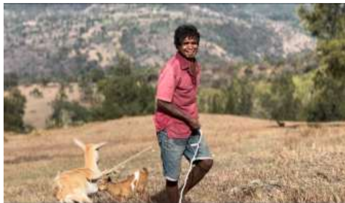
Gambar 5. Ekspresi alami warga desa sebagai subjek pengambilan gambar

Dokumenter menampilkan masyarakat sebagai subjek representasi, di mana kehadiran mereka dalam narasi visual memperkuat autentisitas dan legitimasi identitas budaya yang ditampilkan (Tufte and Mefalopulos 2009). Keterlibatan masyarakat dalam dokumenter tercermin melalui kehadiran mereka secara alami sebagai subjek utama dalam narasi visual (Gambar 5). Representasi ini memperlihatkan bagaimana identitas budaya dibangun dari pengalaman kolektif yang hidup dalam praktik sehari-hari. Kehadiran masyarakat tidak hanya memperkuat autentisitas visual, tetapi juga menunjukkan bahwa identitas budaya merupakan hasil konstruksi sosial yang bersifat dinamis.