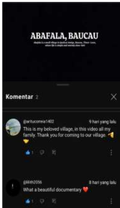
Gambar 4. Komentar Positif Audiens di Youtube ( https://youtu.be/b4oma3XD_1U?si=cf0UMhWt5Akc250x )